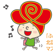
「ふいりあ」北区地域包括支援センター マスコットキャラクター